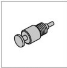
Wolfsvoersmedschap vliegwiel OE (LRT-12-044)